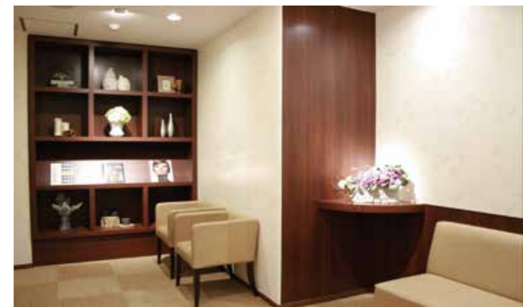
レディースエリア